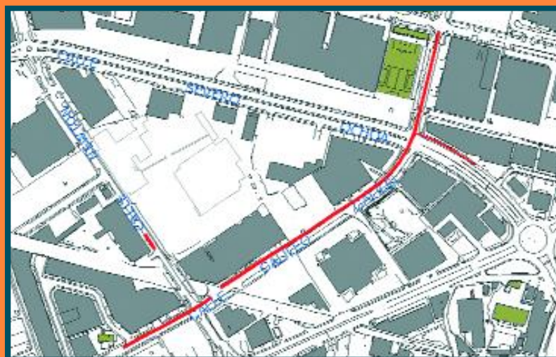
Plano en el que se aprecian las calles en las que se realizarán las obras de la segunda fase del soterramiento de cables

La firma con la empresa adjudicataria de las actuaciones, Canarga Construcciones, que se llevarán a cabo en Agrela, se efectuó el pasado 14 de mayo en las instalaciones de la Asociación de Empresarios.