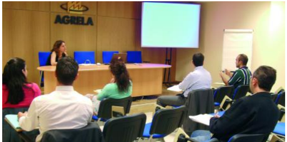
El curso de Técnicas de Venta se impartió en las instalaciones de la Asociación

Está prevista también para los próximos meses una Jornada teórica y una jornada teórico-práctica sobre la reforma contable, en la que se analizarán las novedades legislativas en esta materia y las obligaciones que implican, así como su aplicación práctica en la empresa.