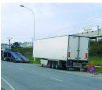
Estado actual de Severo Ochoa

La Junta de Gobierno del Ayuntamiento de A Coruña ha aprobado de forma definitiva el proyecto de urbanización de Severo Ochoa, en el polígono de Agrela. Según el Plan General de Ordenación Municipal se destina un polígono de 12.095 m 2 , con unos 10.160 m 2 edificables, a uso industrial-comercial